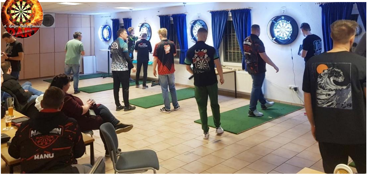
Oben. Die Vorrunde hat sich bis ca. 23.30 Uhr hingezogen.