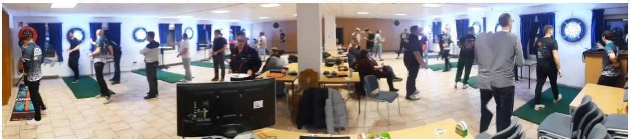
Oben: Hier bekommt man mal einen Überblick, wie intensiv der Spielbetrieb des Turniers ist.